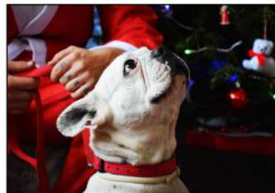
LEROY , des étoiles plein les yeux