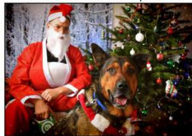
CICCIO et le Père Noël en personne