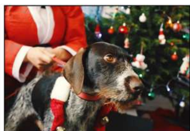
Le si gentil POOPY