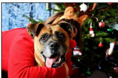
La belle IZZY