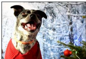
La CHOUETTE de Noël