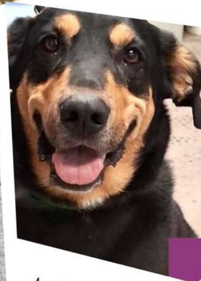
← VECTOR 1 an

ROCCO 5 ans n'est pas à l'adoption, mais il est à placer d'URGENCE en FAMILLE D'ACCUEIL