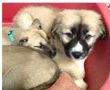
Des petites Merveilles !

Fin mars, nous avons recueilli six « Boules d'Amour », superbes croisements \frac{3}{4} Husky et \frac{1}{4} Cane Corso. Ils ont été mis à l'adoption sur dossiers uniquement. Les familles adoptantes devaient être adaptées au caractère et aux besoins de ces futurs grands chiens sportifs.