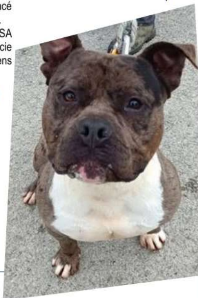
STELLA 4 ans →