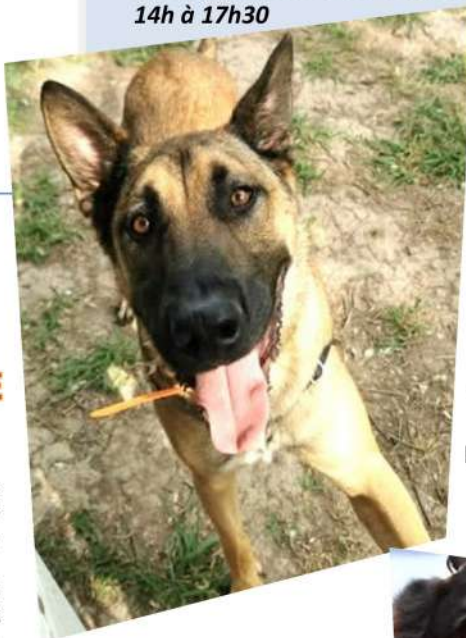
← DOHKO 5 ans Et près de 3 ans au Refuge