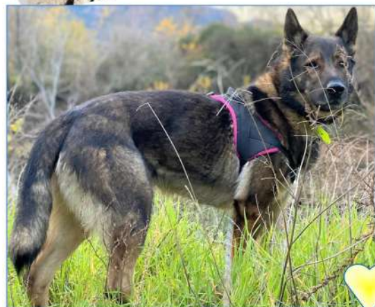
JACKSON 6 ans

Au refuge depuis Novembre 2020 Ce sont nos Chiens "Top Priorités" les plus anciens du Refuge Il y a URGENCE - Retrouvez-les page 2