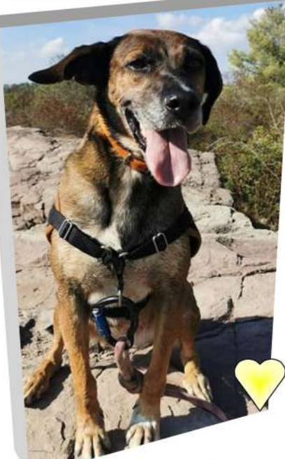
ALPHA, 6 ans au Refuge depuis Juillet 2017