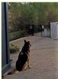
ROCKY attend sa famille qui ne reviendra pas ! Le temps est long, long...

L'important est de trouver la taille et la race du chien qui nous correspond. Que l'on se décide pour un chien de race, qui fait toujours son effet, ou un sympathique corniaud à l'apparence peu protocolaire, au look unique, et à la particularité d'être, grâce au croisement de plusieurs gènes, plus résistant face aux nombreux problèmes de santé qu'un chien pourra rencontrer au cours de sa vie, l'essentiel, nous l'aurez compris, est d'être déterminé à faire son bonheur !