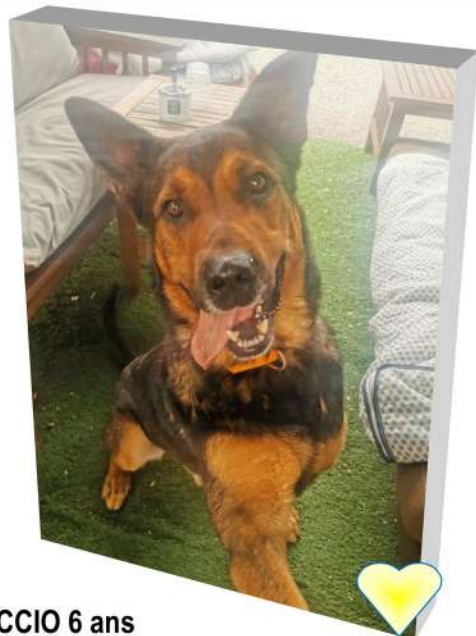
CICCIO 6 ans au Refuge depuis Novembre 2019