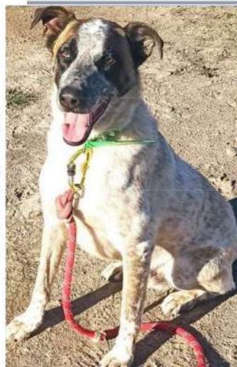
MOMO 10 ans