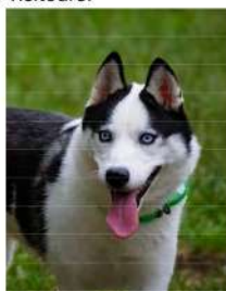
Blue la belle aux yeux bleus