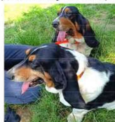
Sergio et Claudio

Une fois par mois, les résidents de l'EHPAD de Roquebrune-sur-Argens, reçoivent la visite des chiens du Refuge. C'est ainsi que SERGIO et CLAUDIO, inséparables Bassets, BLUE, TAMIA et CHIPO, tous très sociables, accompagnés d'un soigneur et d'une bénévole, rendent visite aux personnes dépendantes de l'EHPAD. Tandis que les chiens reçoivent moult caresses, nos doyens bénéficient des bienfaits de leur présence. Ces visites qui seront renouvelées tant la relation humain/chien est essentielle, sont source d'affection, de distraction et d'apaisement pour les personnes âgées ainsi que pour nos chiens visiteurs.