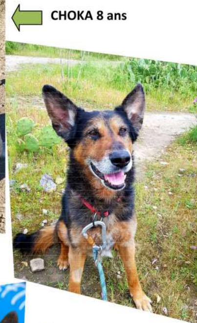
CHOKA 8 ans