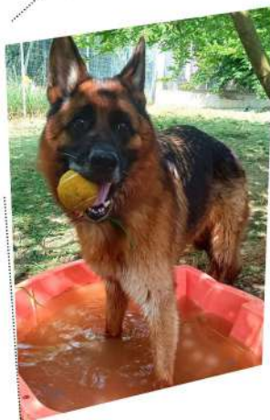
REX, superbe Berger Allemand avec sa nouvelle maîtresse, juste avant le départ vers sa meilleure vie.

Délivré de son horrible prison de 5m2 dans laquelle il avait vécu 4 ans, nous l'avions recueilli. Il avait tout à connaître, et son arrivée au Refuge avait été pour lui, le bonheur. Il vient d'être adopté, et son départ a occasionné quelques larmes de joie chez nos soigneurs et nos bénévoles !... Il vit à présent la meilleure vie possible auprès de sa maîtresse, et nous lui souhaitons un long chemin rempli d'amour.